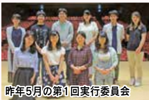
昨年5月の第1回実行委員会

成人のつどいでは毎年実行委員会がテーマを考えます。今年のテーマは「繋ぐ」。「過去と未来を繋ぎ、人と人とを繋ぎ、想いを繋ぎ、希望を繋ぐ」。私たちが今まで繋いできたものを振り返り、今繋がっているものを確かめ、これから繋いでいくものを思い描く。この成人のつどいを、そんな再確認の場にしてもらいたい」という願いを、このテーマに託したそうです。実行委員会は昨年5月の結成から当日までの約7か月間、このテーマに沿って準備をしてきました。