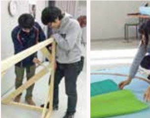
実行委員企画の花かごも手作りしました