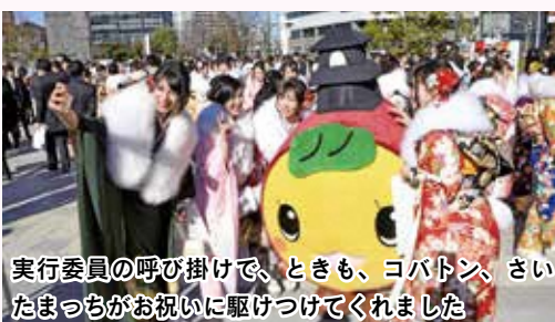
実行委員の呼び掛けで、ときも、コバトン、さいたまっちがお祝いに駆けつけてくれました