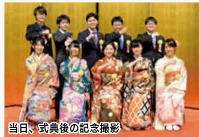
当日、式典後の記念撮影