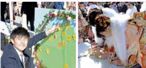
「今日の一言」を花の形の紙に書いて、花かごのボードに貼り付けました