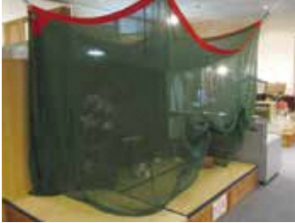
最近あまり見かけなくなった蚊帳

今回は、実際に「触れる展示」として、教科書や遊び用ノート、ダイヤル式黒電話などの生活用品、さらに、夏の寝室の大定番、蚊帳にも直接触れることができます。昔は〇〇で遊んだなあ「〇〇はこうやって使ったよ」など、会話も弾むのではないのでしょうか。「むかし」を知らない世代から、「むかし」をよく知る世代まで楽しめる今回の展示。 ぜひこのタイムスリップした世界で、ひとときの時間旅行をお楽しみください。 期間：2月25日(日)まで 経費：入館料