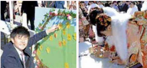
「今日の一言」を花の形の紙に書いて、花かごのボードに貼り付けました