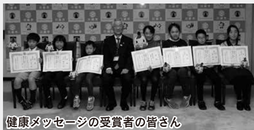
健康メッセージの受賞者の皆さん