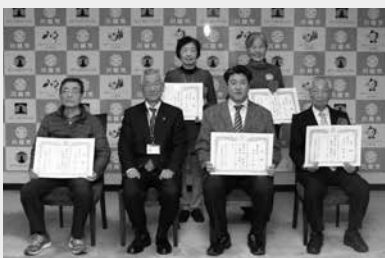
健康川柳一般部門の受賞者の皆さん

また、川越市国民健康保険で40歳から74歳までの加入者を対象に実施している、特定健康診査を周知するためのポスターやチラシ、封筒、パンフレットなどにも掲載する予定です。