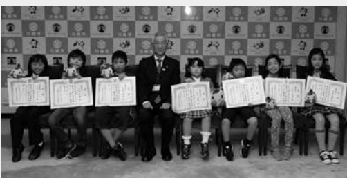
健康川柳小学生部門の受賞者の皆さん