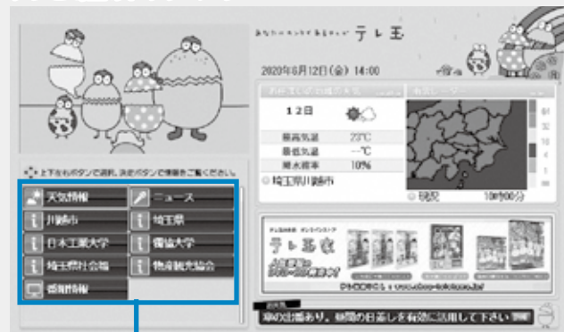
トップページにある「川越市」を選び、リモコンの決定ボタンを押す