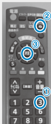
機種によって「d」ボタンの位置は異なります

*「市町村からのお知らせ」と表示された場合は、それを選択してください。また、データ放送に対応していないテレビでは視聴できません。