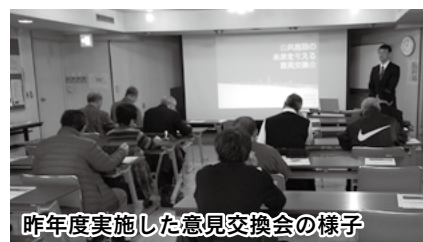
昨年度実施した意見交換会の様子

また、日常生活や経済活動を営むために不可欠な都市基盤であるインフラ施設でも、個別施設計画をそれぞれ策定し、老朽化の課題に取り組んでいます。