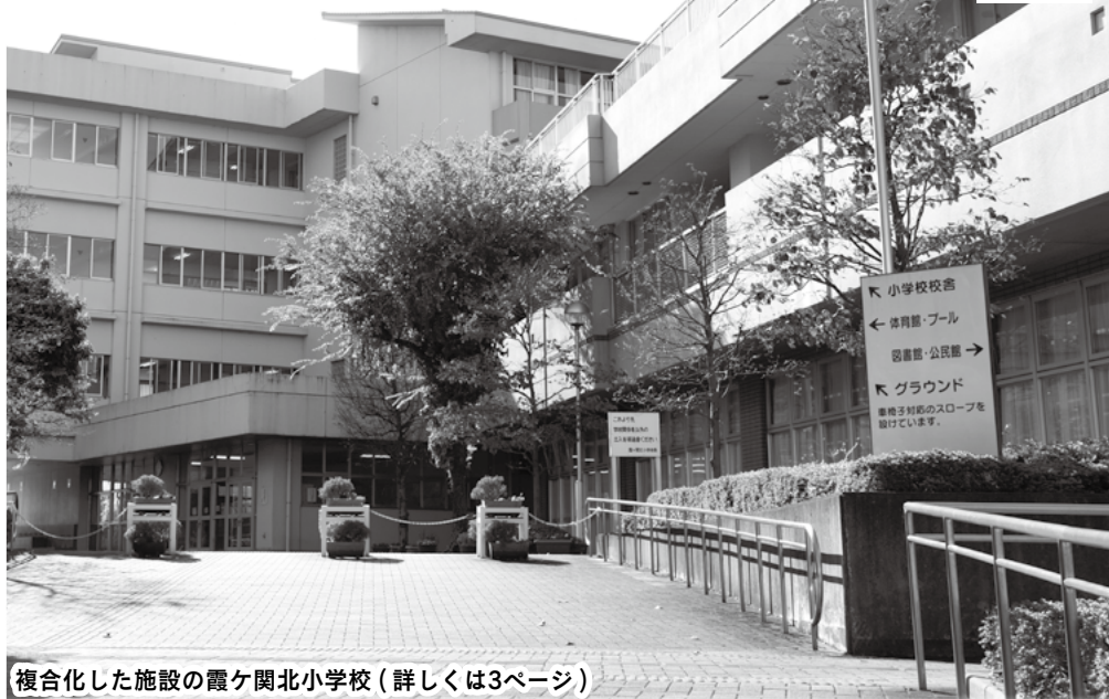
複合化した施設の霞ヶ関北小学校（詳しくは3ページ）

市では、公共施設を使った行政サービスを継続して提供するために、社会資本マネジメントの取り組みを進めています。