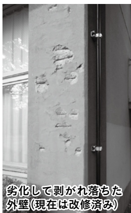
劣化して剥がれ落ちた外壁（現在は改修済み）

また、建築から40年以上経過している施設は、市が管理する公共施設の総床面積約78万㎡（東京ドーム約17個分）のうち、3分の1以上にあたる約28万㎡にもなり、多くの施設で劣化が生じています。これらの施設では改修や建て替えが必要になります。