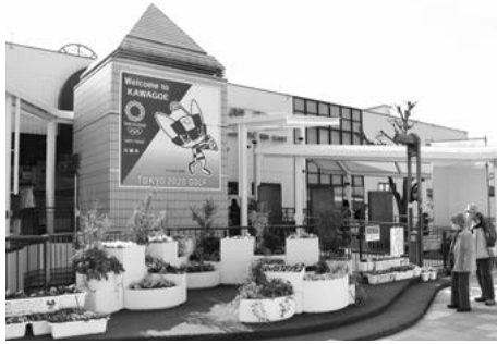
川越駅東口駅前広場にある花壇