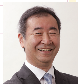
梶田隆章さん