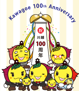
川越市マスコットキャラクターときも