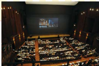
記念式典が開催される ウエスタ川越大ホール