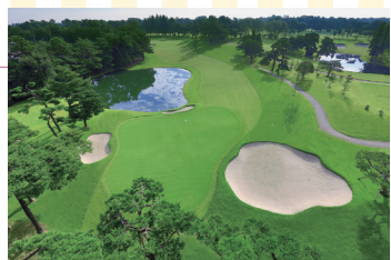
East Courses No18