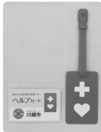
ヘルプカード(写真左)とヘルプマーク(写真右)。ともに、赤色を基調としています