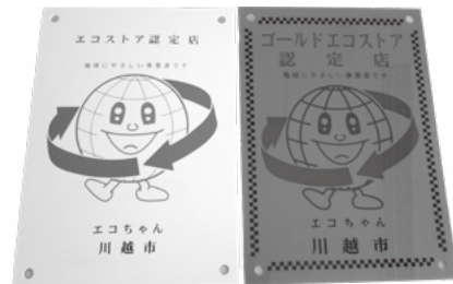
エコストア認定板(左)と ゴールドエコストア認定板(右)

ごみの減量・資源化や地球に優しい事業活動などを積極的に行っているお店や事業所を認定する制度です。