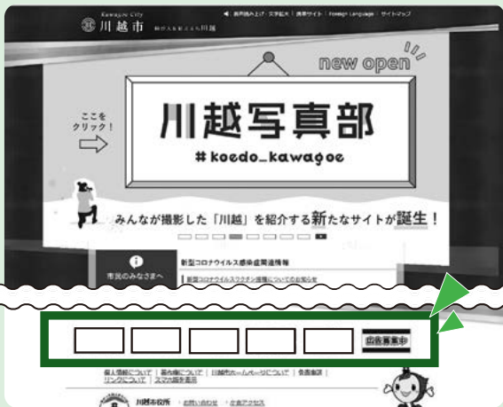
トップページやメインカテゴリ等、全7ページに掲載されます