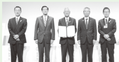
国内姉妹友好都市との共同宣言への署名

第1部の記念式典では、国内外の姉妹友好都市の各首長からお祝いのメッセージがあり、さらなる交流の発展を見据えた共同宣言が取り交わされました。第2部のシンポジウムでは、「都市間交流と若者の未来」をテーマに、パネリストや特別ゲストの皆さんが10代での異文化体験の大切さ等について話し合いました。ぜひ、ご覧ください！