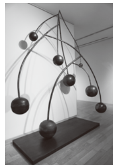
高田純嗣 「空から降る種」 鉄 2022年

日時…12月23日(出)午前10時～正午 経費…100円 定員…20人(抽選) 申し込み…12月5日(火)までに電子申請・電話・ファクスで同館