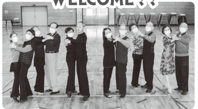
撮影協力：高階社交ダンスクラブ