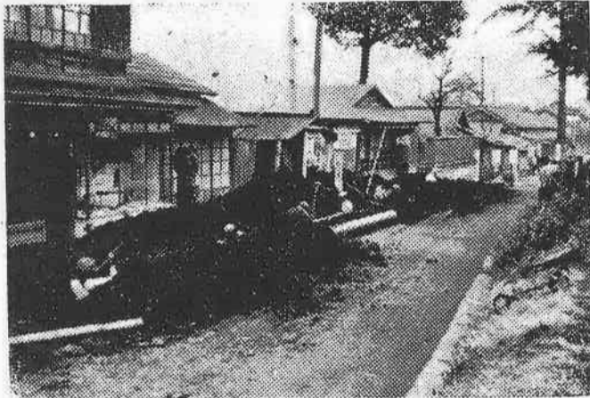
郭町附近水道配管工事

埼玉県では町村の九割が人口八千以下のところから、昨年十月県に埼玉県町村合併促進審議会が出来、更に各地方事務所単位で色々町村合併の研究をして居りますが、この機会に川越市でも近村を合併して大川越市を建設するため、こゝに川越市町村合併促進委員会が出来たわけではあります。 川越市の面積はわずかに、一七・六平方町で町村の標準面積三〇平方町の半分しかなく、面積の狭いことでは全国二百八十餘の市のうち終りから二十八番目川越市より、面積が狭くて川越市より人口の多い市は全国で僅か六つしかなく、このため市営住宅の建築その他色々の公共事業を進める上にも不便も多く、交通問題の解決その他市勢振興の上からもどうしても近村の合併を必要とする事情にあり、一方近村の側から見れば川