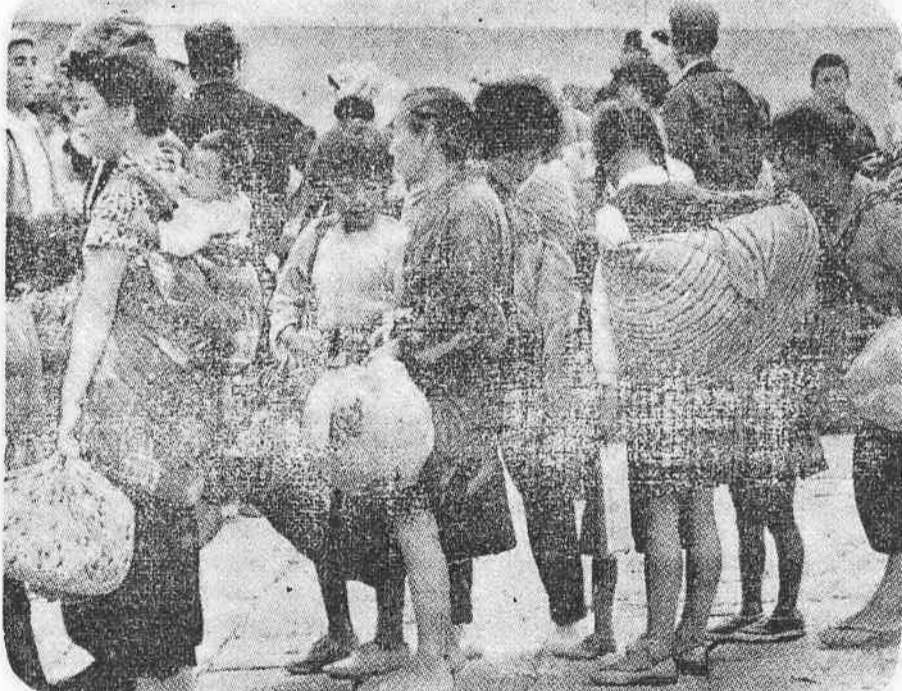
◇わが家を失つたこの人たちに愛の手を◇(広報あいちより)