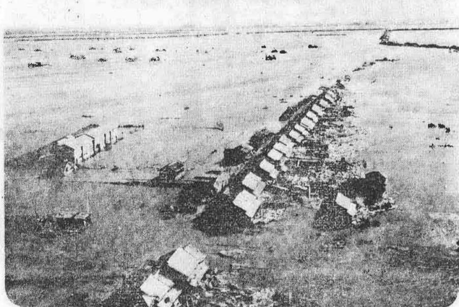
◇伊勢湾台風の惨禍◇