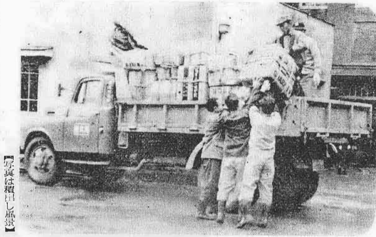
写真は積出し風景