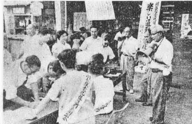
☆川越線の電化促進☆ (川越駅前) 8月16日~22日 ☆署名運動を展開☆

分り下水の埋設を完成して、いまも現在これだけの施設をする場合には、七億円の工費を要します。下水の汚水処理施設として使われるものです。