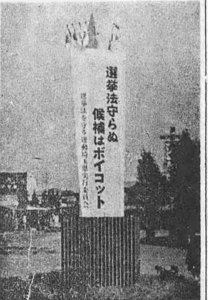
(写真は本川越駅前(の)広告塔)

衆議院議員の総選挙と参議院議員の補欠選挙が十一月二十日(日)に行なわれることになりました。またこれにあわせて十年以上在任した裁判官や新たに任命された裁判官を審査する最高裁判所裁判官国民審査も行なわれます。衆議院、参議院は国の立法府として最高裁判所は最高司法権をつかさどるいすれも大切な機関です。同の政治が立派に運営され裁判が正しく行われ、よりよい安定した生活がおくれるかどうかはこの機会に選挙で選ばれるかといえます。よく人物をみきわめて立派な議員、正しい裁判官をおくりたいものと選挙管理委員会ではよまかけています。そのよまかけのなかから特に注意したいことをいくつかおまかせしてみよう