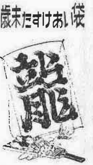
川越市社会福祉協議会

ジングルベルの音楽が町に流れ出し、師走(しわす)の風が吹き抜けてゆくと、急に才末のあわたたしさが満ちてまいります。人々は、一年のしめくりと、迎春のせわしさに無中になりがちです。日ごろは、不幸な人たちに寄せる愛の募金運動などにも、とてもせわしさに追われて、つい忘れがちです。しかし、働き手を失った家庭や病気で働けない人や、両親のない孤児、母子家庭、世の中にはまだまだ多くの不幸な人たちが寒さに暖も少なく、暮も、お正月もないのです。国も県や市町村も社会福祉の向上をめざしてあらゆる政策を行なつて努力を続けております。しかしより多くの手をさしのべるために、この上にみなさまの隣人愛を望んでいます。