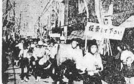
棄権防止に鼓笛隊パレード

1 川越市観光協会 2 川越市観光協会 3 川越市観光協会 4 川越市観光協会 5 川越市観光協会 6 川越市観光協会 7 川越市観光協会 8 川越市観光協会 9 川越市観光協会 10 川越市観光協会