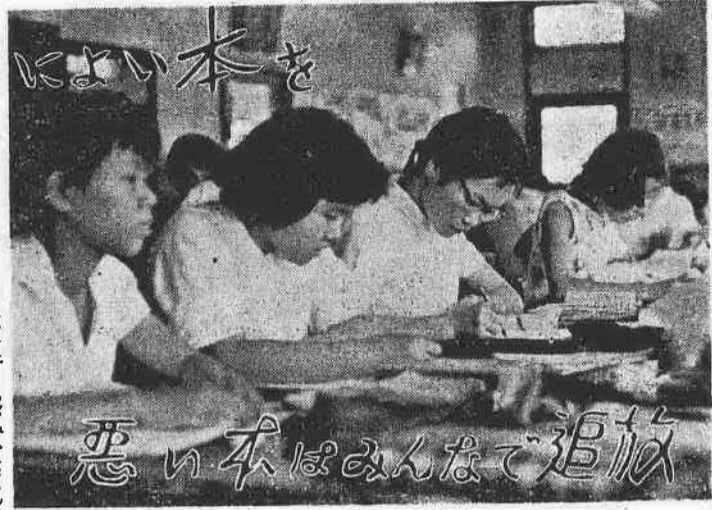
悪い本はみんなて追放

あなたの子どもが、いまどんな本を読んでいるか、ご存じですか。 読書のシーズンを迎えるにあたり、青少年の読書熱をいっぺん高めたいが、本屋さんの店頭に、いまどんな本が並んでいるのか、読んでみます。 ここでもおなじみ「悪い本」は、読書のシーズンを迎えるにあたり、青少年の読書熱をいっぺん高めたいが、本屋さんの店頭に、いまどんな本が並んでいるのか、読んでみます。 ……家庭では、つねに青少年の読書に注意し、有害な本は買わないようにすること。 ……学校では、有害な本は買わないようにすること。 ……読書指図書を行ない、学校全体が、読書のふんいきになるようにつとめること。 ……青少年にその趣旨をよく話し、有害な本をばいばいするようにつとめること。 ……読書指図書を行ない、学校全体が、読書のふんいきになるようにつとめること。 ……青少年にその趣旨をよく話し、有害な本をばいばいするようにつとめること。