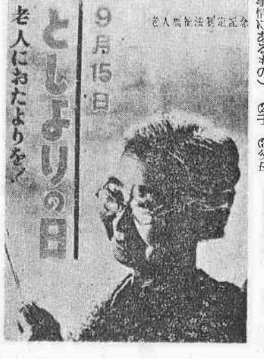
老人におたよりを

準世帯主にも七割給付 国民健康保険では、ことしの四月から世帯主に対して七割給付を申し渡した。世帯主が他者の社会保険に加入している世帯はこれに該当していません。