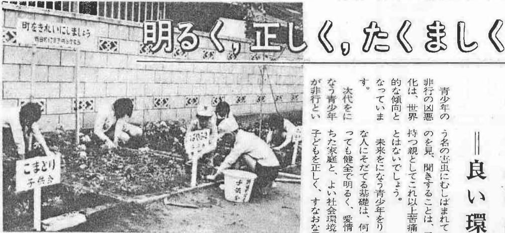
(写真は花だんつくりをする野田町丁目子供会)

この期間は、真夏の太陽の光も、職場や、町内のスポーツ大会、グループや家庭のハイキックなど、さわやかな秋空のもとで、灯火に親しみ、心身を養う期間としての運動を市民総ぐるみで展開することです。