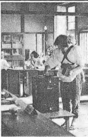
【写真は県知事選の投票風景】

わたくしたち埼玉県知事選挙の首長選挙は、埼玉県知事選挙が、六月三十日に行なわれました。川越市では三十五万所の投票所で行なわれ、投票率は前回より一%をそれぞれ上まわり過去