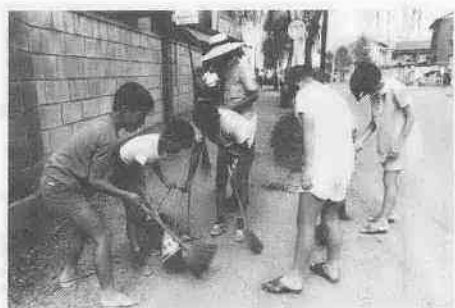
三光町で道路清掃

埼玉県消防協会第2ブロック会主催の、第5回消防団ポンプ操法大会が、8月5日市民グラウンドで行なわれました。当日は、入間・比企郡下から予選を勝ち抜いた28台(可搬の部7台、自動車ポンプの部21台)が参加し、ポンプ操法のわざを競いました。