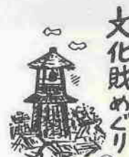
文化財めぐり 丸木舟 (県指定有形文化財)

小児マヒ予防生ワクチンの投与が11月9日から各会場で行なわれます。接種当日は必ずお子さんの体温をはかってきてください。なお、くわしくは前号の「広報川越」をご覧ください。