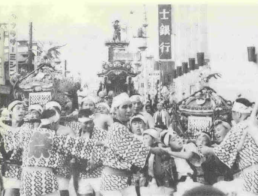
盛大に行なわれた、恒例の川越まつり

市民の健康は私たちの手で、と10月13日、川越市薬剤師会が中心となって、薬と健康の週間にちなんで、一日相談センターと、自動車の排気、騒音を主に公害調査を行いました。