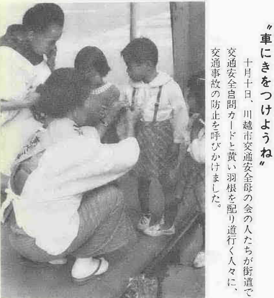
十月十日、川越市交通安全母の会の人たちが街道で交通安全自問カードと黄い羽根を配り道行く人々に、交通事故の防止を呼びかけました。

10月10・11日の両日、市内の少年少女約100人による武者行列が、市内をねり歩きました。この催しはことしはじめてのもので、商工会議所が開所70周年の記念行事として行なったものです。