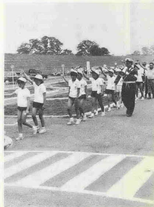
楽しく遊びながら交通ルールを身につけて交通事故の防止に役立てていただくよう、入間川の河川敷に交通公園を設置しました。このほか月越、第一、武蔵野、山田、古谷の各小学校にもつくられています。

躍動を続けた、昭和四十五年もあと数日で終わろうとしています。この一年をふり返ってみると、国の内外で、一九七〇年代の歴史のページを飾った多くの出来事があります。国内では、大阪で開かれた万国博覧会、戦後始めて沖繩を含んで実施された国勢調査、そしてわたしたちのまち川越市でも、関越高速道路の建設工事が着手されたこと、人口が十七万を突破したことなど、数多くの明るいニュースがありました。特に、近代都市として必要な諸施設の建設は目まぐるしく、質、量ともに昨年来大幅に上まわっています。働く婦人や主婦のいこいと教養の場である婦人会館の建設、霞ヶ関小・中学校の防音校舎建設をはじめとする学校の増改築、芳野公民館の建設、古谷公民館の起工、月吉町及び高階保育園の新設、名細小・高階中学校の体育館、そして都幾川村に開設した山の家、伊佐沼湖畔へ建設中の老人福祉センター、山車集中保管庫、市営住宅、運動公園および交通公園、市街地北西部を結ぶバイパス(神明町境町線)の工事、下水道処理区域の拡張など、広範囲にわたって行なわれ、公共施設が大幅に充実してきました。しかし、人口は年々著しく増加しており、川越市が今後大きく発展して行くためには、まだまだ多くの施設の建設や整備を必要とするものが出てくると思います。明年、すなわち昭和四十六年には市役所の新庁舎の建設も計画されており、道路、教育、福祉施設等の建設をはじめ、近代的で明るく住みよい町づくりのための諸施策が、積極的に進められます。