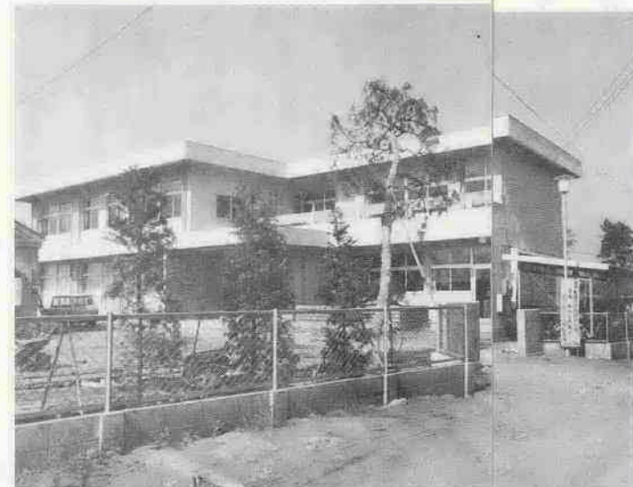
に、モダンな建設されました。古谷地区にも公民館は一般養の場としてのものです。

教育施設の整備拡充は市の重点施策になっています。特に本年は名細小の増築完成を皮切りに8小学校の増改と霞ヶ関小中学校の防音校舎など98教室の増設が行なわれました。また体育館は名細小、東中に設置され、現在高中学校に建設中です。(完成した名細小の校舎と体育館)