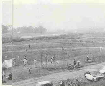
川敷を利用した上戸運動公園は、ことしの8月に開設されるのスポーツの場として期待されています。