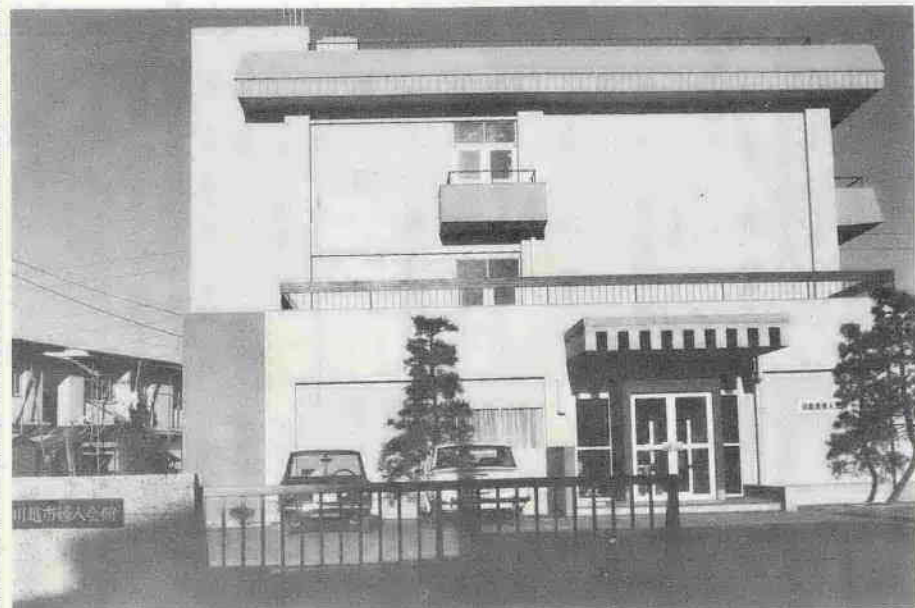
6月1日に開館した婦人会館は、働く婦人や主婦などのいこいの場として建設されたもので、県下では4番目のものです。各種講座や講演会など、婦人の教養を高める場として毎日利用されています。

教育施設の整備拡充は市の重点施策になっています。特に本年は名細小の増築完成を皮切りに8小学校の増改と霞ヶ関小中学校の防音校舎など98教室の増設が行なわれました。また体育館は名細小、東中に設置され、現在高中学校に建設中です。(完成した名細小の校舎と体育館)