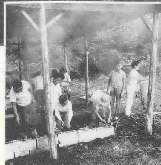
比企郡都幾川村の奥武蔵高原に建設した「川越市山の家」は8月3日にオープン。近くには堂平山や刈場坂峠、大野峠などへのハイキングコースもあり、夏休みには子どもたちで連日にぎわいました。