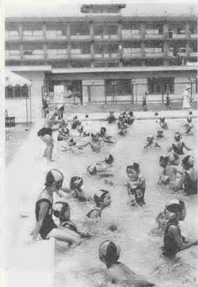
小学校にプールを中学校に体育館を、この方針で進められた教育施設の建設も着々と進み、プールは新設校の高階南小を最後に19の全小学校に設置されました。