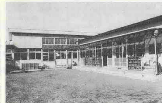
市では毎年のように1~2の保育園を建設しています。ことしは小ヶ谷、脇田新町、菅原町の各保育園を改築しそれぞれ定員増を図るとともに、月吉町、高階地区にも新しい保育園を建設中です。(写真は改築された小ヶ谷保育園)