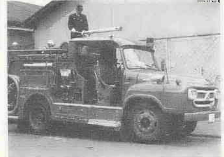
市民が行なわれた、消防特別点検に初登場した化学消防車は、来賓や関係者多数が見守る中で、その威力を十分に披露しました。

消防署では、石油類などの危険物を取扱う会社や工場等が多くなっていることから、このほど化学消防車を導入しました。この消防車は、常時1,000ℓの水と300ℓの泡原液を積載しており、一般火災のほかとくに油火災に威力を発揮します。