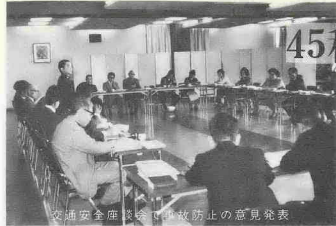
交通安全座談会で事故防止の意見発表

に伴う死者は一万六千二百七十八人、負傷者は実に九十四万九千六百八十九人のぼつています。この数字を前年に比較してみますと、発生件数は一万七千七百九十件(二・五割)、死者は四百八