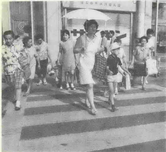
横断歩道は正しく渡りましょう