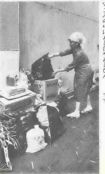
△ゴミの中にあき缶やあきびん、ヘアスプレーなどの危険物は絶対に入れないでください。

夏になると家庭から出されるごみは、水分を多量に含んだものが多くなります。水分を含んだごみが多くなると、じん芥焼却場の処理能力はいちじるしく低下してしまいます。そこで、家庭ではとくに次のことに注意して、ごみ処理にご協力ください。