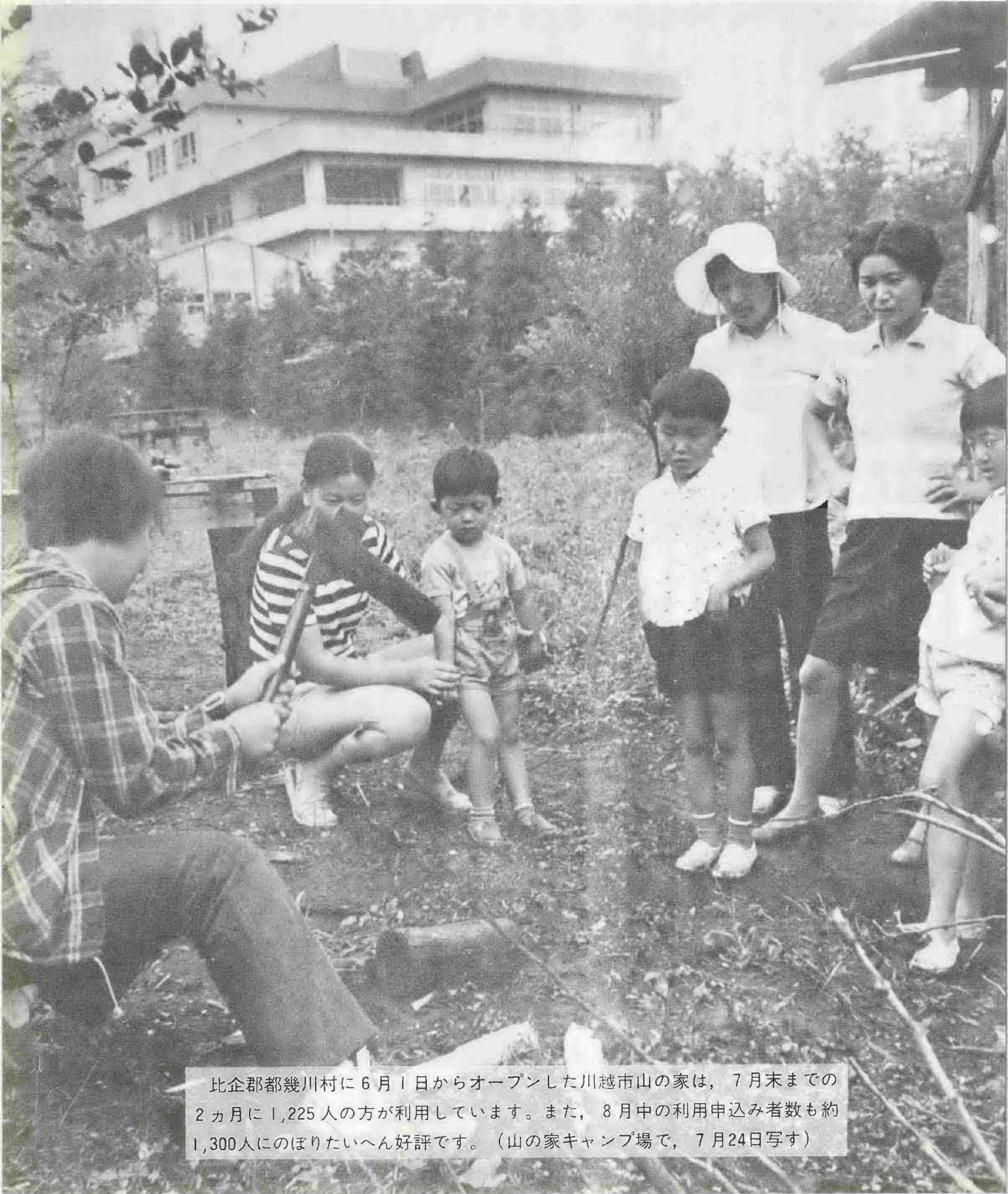
比企郡都幾川村に6月1日からオープンした川越市山の家は、7月末までの2ヵ月に1,225人の方が利用しています。また、8月中の利用申込み者数も約1,300人にのぼりたいへん好評です。(山の家キャンプ場で、7月24日写す)