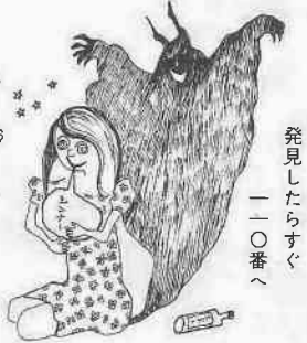
発見したらすぐ —一〇番へ

▽シンナーや接着剤を売ったり、与えたり、場合も同時に罰則が適用されることになって