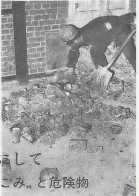
必ず別々にして燃える“ごみ”と危険物

家庭などから持ち出すごみ袋の中には、あき缶やビン等の危険物を絶対に入れないよう、ごみを協力をお願いしています。 ごみの中に危険物が入っていると、焼却能力が低下するばかりでなく、焼却炉を痛めるなど処理作業に大きな支障となります。最近の例として、ごみの中に混入し