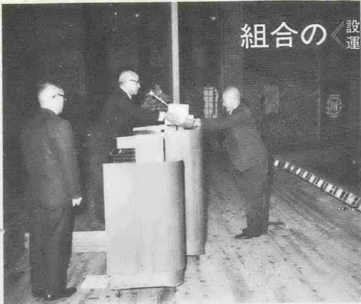
昨年度の優良納税組合表彰式