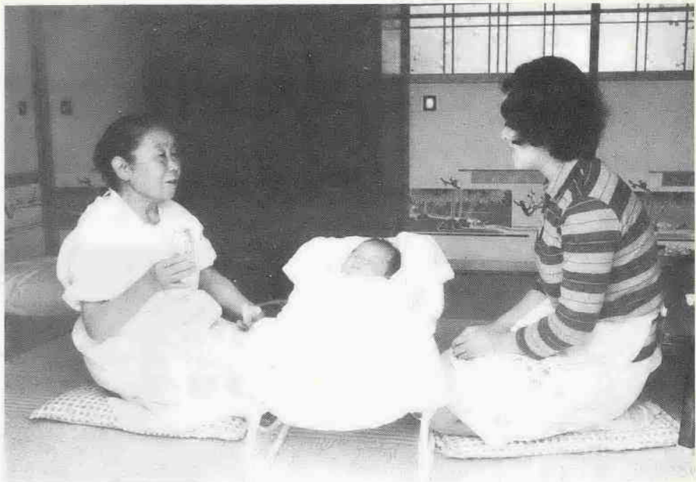
すこやかな成長を願って