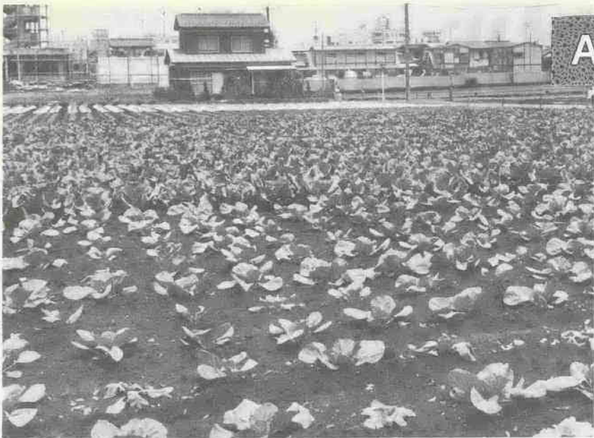
市街化区域内の野菜畑(新宿町で)

市では、市街化区域内のA農地およびB農地の所有者と緑地保全の協定を結び、その所有者に交付金を交付し緑地を保全しようとするものです。 市では、市街化区域内に市民生活に必要な適度の環境を保つ目的で市街化区域緑地に関する要綱を制定しています。 これは、市が市街化区域内のA農地およびB農地の所有者と緑地保全の協定を結び、その所有者に交付金を交付し緑地を保全しようとするものです。 すでにA農地については昨年度から実施しており、B農地も本年度から実施になります。