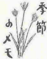
季節 のメモ (12月上・中旬)

人へ音楽之友社、▽田口耕三「や っちゃば育ち」二見書房、▽力武 常次「地震予知」中央公論社、▽小 倉芳彦「古代中国を読む」岩波書店 ▽石川達三「その最後の世界」新潮 社、▽源氏鶏太「艶めいた海」実業 之日本社