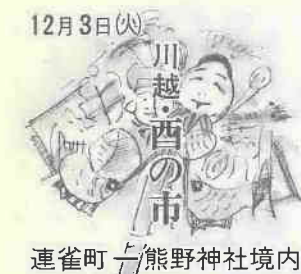
12月3日(火) 川越西の市 連雀町 熊野神社境内

歳末たすけあいに ご協力を 今年も十二月一日〜三十一日まで、全国いっせいに「歳末たすけあい運動」が行われます。十二月は一年の決算月のため皆さんの家庭でも何かと出費の多いことと思えますが、ご協力くださるようお願いいたします。