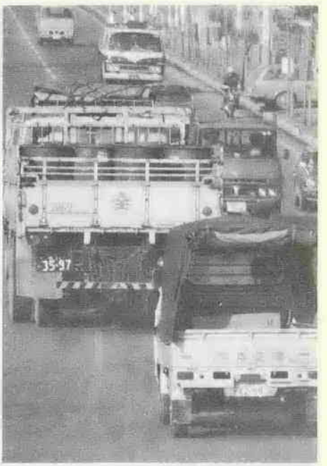
川越市交通災害共済制度の主な内容は次のとおりです。