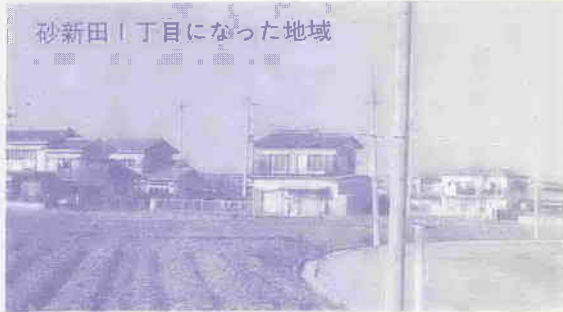
砂新田川丁目になった地域