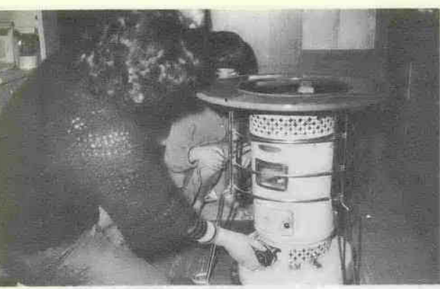
テレビの防災番組

④ せんとく物の乾燥用などには使わない。 ⑤ 使用後はスイッチを切るだけでなく、コンセントからコードを抜く。