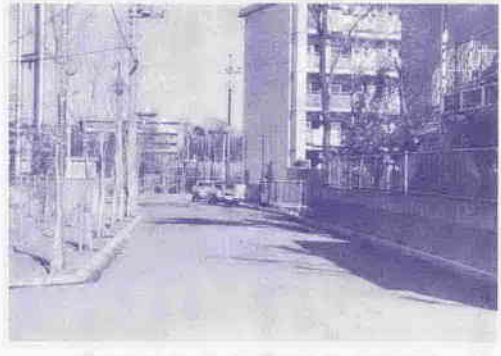
認定された今福地内の市道