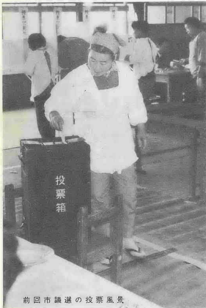
前回市議選の投票風景

四月十三日に執行の埼玉県議会議員一般選挙から、郵便による不在者投票制度が新しく設けられましたので、その内容をお知らせします。