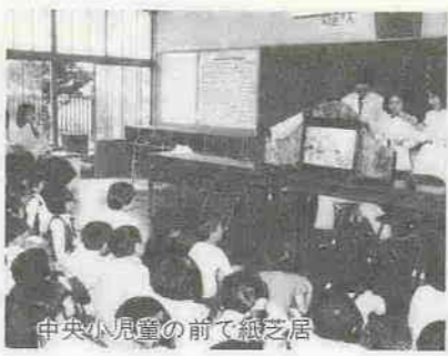
中央小児童の前で紙芝居