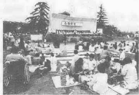
楽しさいっぱいのしあわせ広場

寺のヤキソバ屋さん」に合せて手拍子を打つ車イスの若者、そして笑顔でいっしょに歌う車イスを押す女子高校生。五月二十四日、伊佐沼畔の市民の森に、しあわせ広場が誕生。あいにくの曇り空にもかかわらず訪れた約二千人の明るい声が、一日中市民の森にこだましています。