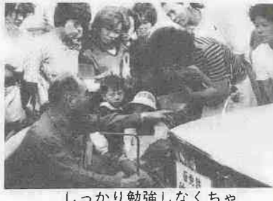
しっかり勉強しなくちゃ