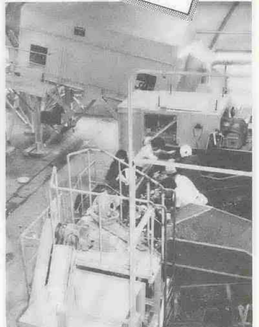
1日300トンの焼却できる西清掃センターの内部は...

あなた次第で「ゴミ」も資源に... 前略 結婚と同時に川越に住み3年目になる26歳の主婦です。