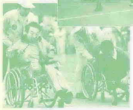
【川越市身体障害者スポーツ大会】