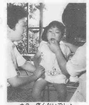
ホラ、痛くないでしょ

うっとおしい梅雨空の下 心なごますアジサイ咲く アジサイ——花言葉は「移り気」。6月11日、関東地方も一せいに梅雨入り。これを待っていたかのように、市内のあちこちでアジサイが咲き出した。七変草ともよばれ、気ままた色を変えるこの花。なんとなく気がめいるがちな梅雨空の下、道ゆく人の心をなごませている。(元町1丁目)