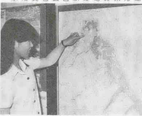
市役所の1階ロビーにも掲示