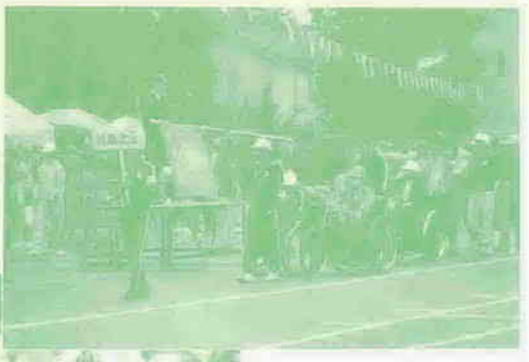
車椅子びん釣り競技