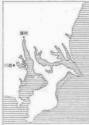
紀元前7000～8000年ごろの海岸線

紀元前七、八千年ごろには旧市街地の東側台地から南に向けて海岸線を形成して、小仙波貝塚は、そのときの東京湾の西の限界を示す重要な遺産です。また、郭町二丁目の三芳野天神 に伝わる縁起によると、昔、鷲宮明神という男女二神が琴と大刀を持ってこの地を過ぎたことから、ここを「川越」と呼ぶようになった、という説があります。鷲宮明神の渡河をもって川越と名づける——これは、いわゆる地名伝説の一つでしょうから、真疑のほどは 行した「埋蔵文化財地図」にある遺跡地名表によると、市内の遺跡の数は九十七か所。そのうち縄文時代の遺跡は三十三か所にものぼります。この分布図を詳細にみると、遺跡のある場所が二つに大別されることが分かります。その一つが、小仙波貝塚に代表される地帯、縄文時代前期のこれらの遺跡は、当時の生活が海の幸にたよっていたことを示しています。もう一つが、霞ヶ関地区から名細地区にかけての小畦川流域、重要テーマです。以後、紀元前二百年ごろまで続く縄文時代、高階地区の寺尾貝塚付近では今も貝殻が出るということが知られています。