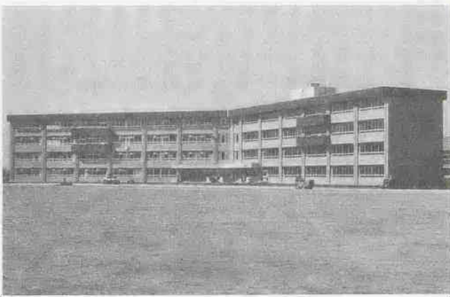
市内17番目の野田中学校

次に、民生費について申し上げます。 民生費の総額は七十四億七千五百八十八万八千四百四十四円といたしました。福祉行政につきましては、明るく住みよい生きがいのある環境づくりを目標として、老人、心身障害者、婦人、児童、青少年等が安心して生活できるよう推進してまいります。老人福祉につきましては、ねたきり老人に対する手当を増額し、家族介護者の労をねぎらうことといたしました。また、川越老人ホームについて