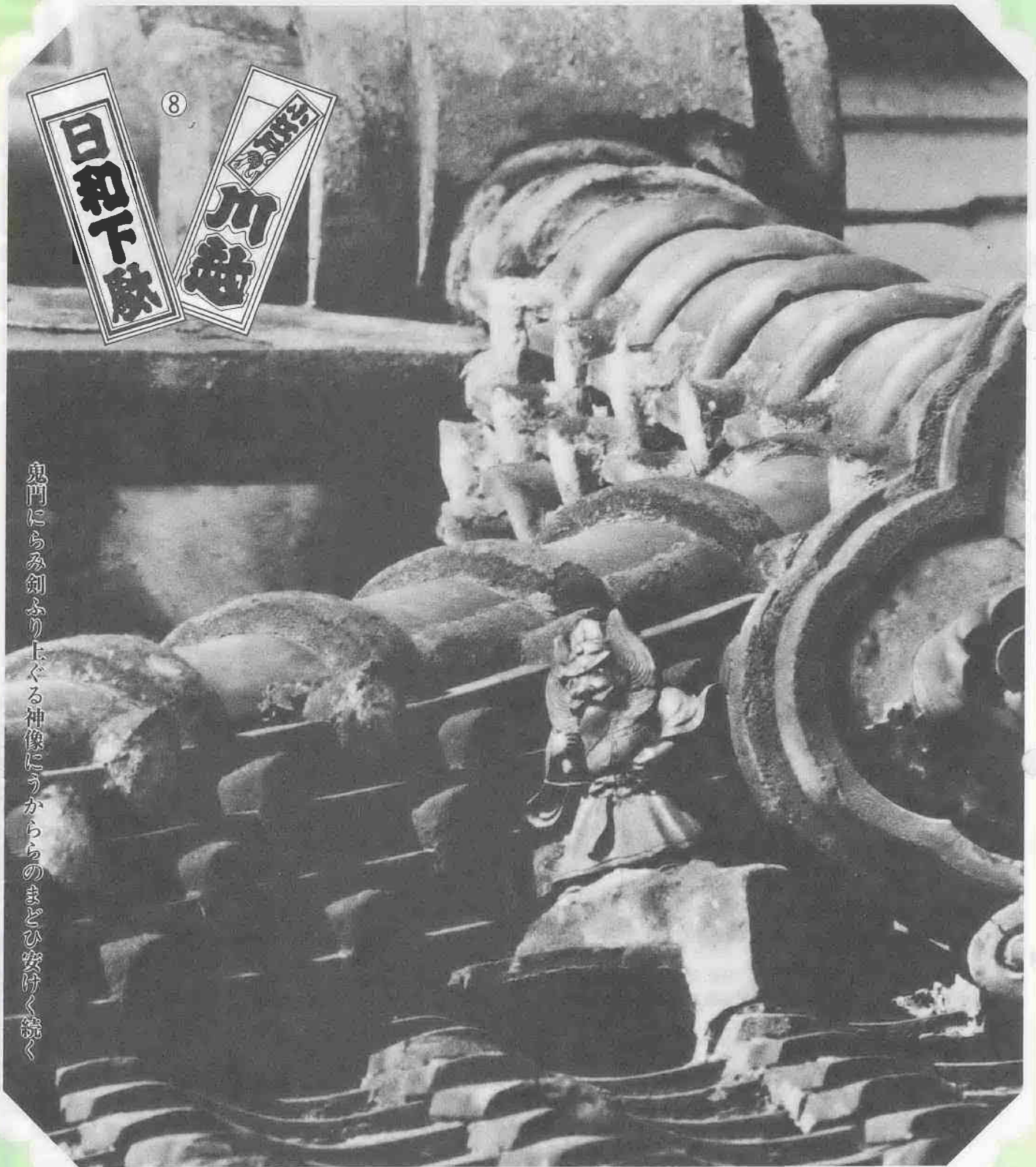
鬼門にらみ剣ふり上ぐる神像にうかららのまどひ安げく続く

20cm足らずの身の丈に、肩をかしげてどんぐりまなこ。瀬戸物商ヤマワさんの屋根、鬼瓦に隠れて鐘馗様がまちを見下ろしている。幸町は一番街の真ん中、埼玉銀行のあたりを蔵造りの本丸という妙だろうか。本川越駅の方から北へ歩くと、まず目に飛び込んでくる仲町の松崎スポーツ店にもち亀屋。これを大手門だとすればの話である。蔵造り商家が重厚な軒を連らねるこの界わい。古くから川越に住む人は、屋号でお互いを呼び交わす。「近滝さん」「まちかんさん」「フカゼンさん」というように。魔除けなのだろう、本丸の屋根から巽の方角(東南)を見守る鐘馗様。なんとなくユーモラスでもある。端午の節句も過ぎた今、初夏の日差しに何を思っているのか。