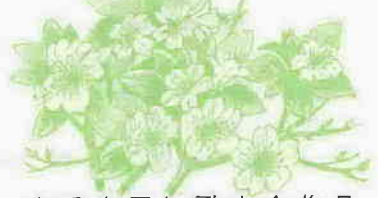
春季市民短歌大会作品