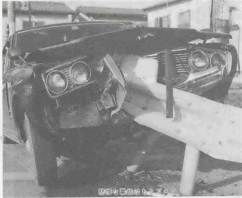
悲惨な事故はもうゴメン

「この心構えを忘れずに守りましょう。また、運転する人には絶対に酒をすすめないという意識をみんなが持つことも大切です。市、警察署および交通安全推進機関・団体では、広報、街頭指導、夜間の取締りを通じてこれらの目標の推進を図ってまいりますから、皆さんのご協力をお願いします。」