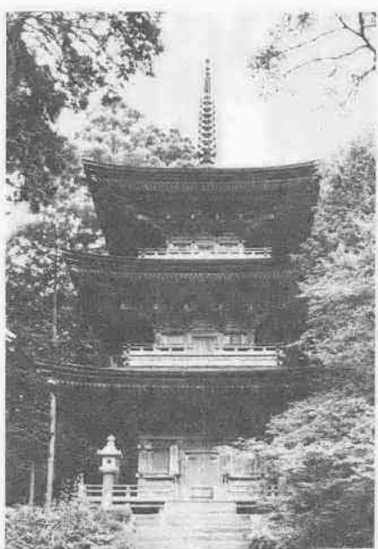
小京都、小浜には文化財も豊富 国宝 明通寺三重塔

人口三万四千三百六十七人。面積二百三十三・七平方。屈曲の多いリアス式海岸特有の長い海岸