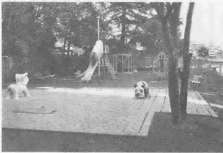
パンダ公園は高沢橋(メガネ橋)のそば