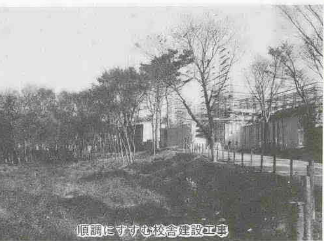
順調にすすむ校舎建設工事

「アカマツヤソロ、アオハダといった雑木林をそのまま残し、緑豊かな学園をつくりたい」と、そんな願いの込められた市内七番目の県立高校が、来年四月高階地区・砂新田にオープンします。 校地面積は四万三千七百平方メートル。所在地：砂新田二五四番地 八分 ▼新河岸駅から徒歩で約十八分 ▼西武バス(本川越駅→新所沢駅)「今福山田」バス停から徒歩で約十二分 〈生徒の募集〉 全日制課程普通科(男女四百五十人)を募集。募集要項は一月八日(土)から県立川越南高校(藤倉五二)で配布します。 ※くわしくは、同校開設準備室(川越南高校内、44-1171)へお問い合わせください。