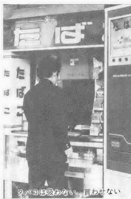
夕まヨは吸わない、買わせない