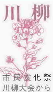
柳川 祭から 市民文化 市川柳大会