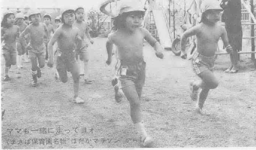
「ママも一緒に走ってヨオ」(まはは保育園名物「はだかマラソン」)

保育園の保育料が、今年4月から昨年同様実質3.5%引き上げられます。保育園運営費の増加という現実を踏まえ、市保育料審議会の答申に沿って決定した新年度の保育料。市民の皆さんのご理解ご協力をお願いいたします。