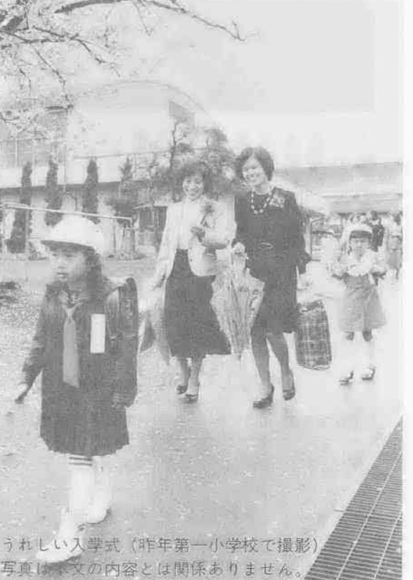
うれしい入学式(昨年第一小学校で撮影) 写真は本文の内容とは関係ありません。

お母さん、お子さんの入学・進学資金の準備はお済みですか？ 義務教育から大学まで、これから必要な学費などを援助する制度をいくつか紹介してみました。ぜひご利用ください。