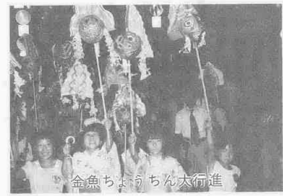
金魚ちようちん大行進

【応募方法】 記入事項：官製ハガキに住所・氏名・年齢・職業(学校名・学年)電話番号を記入、「サブタイトルの部」「ワッペンデザインの部」を明記のこと。 【応募用紙記載例】 川越市仲町一丁目 川越商工会議所内 川越百万灯夏まつり 実行委員会行 作品 氏名 住所 年齢 職業 電話番号 【応募用紙】「サブタイトルの部」「ワッペンデザインの部」とも官製ハガキの裏に左図のように書いて郵送 応募締切：3月10日(木)(当日消印有効) 送り先：問合せ：川越市仲町1-12 川越商工会議所内「川越百万灯夏まつり実行委員会」(☎22-3100)