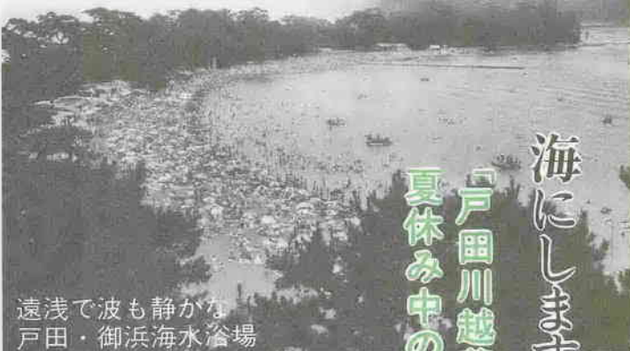
遠浅で波も静かな浴場 戸田・御浜海水浴場

市では、「戸田川越荘」と「海の家」、「山の家」の夏休み中の利用申込を受け付けます。 静かな海でのんびりと泳ぎ、名物の「高足ガニ」に舌づつみを打ちたいというなら西伊豆・戸田川越荘。 九十九里の雄大な海で、思いきり夏を満喫したいむきには蓮沼・海の家。 そして、キャンプファイアーを囲んで、グループで歌やゲームをというなら山の家がピッタリ…。 趣は違えど、いずれにしても楽しい夏の思い出になることはまちがいありません。ご家族そろって申し込みを。