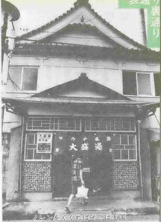
計・足拭きの大雑布・清涼飲料の冷蔵庫・大型扇風機は男女両方に備えてある。(中略) 大時計は鏡の高所に掛けてあるので両方から見上げられるようになっている。(中略) 洗い場の天井は高く、両壁面は大鏡がはめこまれてあるのて明るい。浴槽はも昔も熱湯と温湯に分かれ、大きな蛇口で湯の好みの濃加減に調節できる。浴槽の背面の大きな壁面は、昔は松島とカニの松原であったが、このころはマッターホルンとカオランダの風車とで風景までも世界的