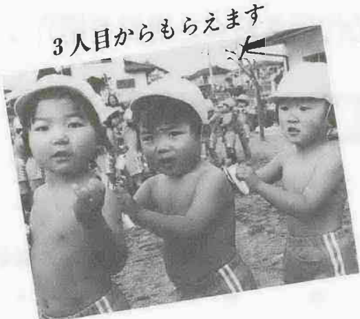
3人目からもらえます