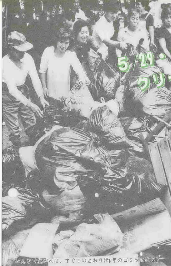
みんなで見れば、すぐこのとおり(昨年のゴミゼロの日)

私たちの生活は、便利になればなるほど、その一方で空きかん、立て捨て看板、放置自転車のような「街を汚すもの」も生み出してきました。