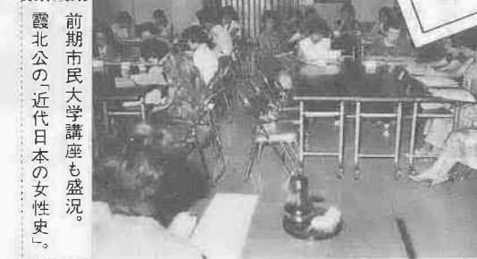
前期市民大学講座も盛況。霞ヶ関の近代日本の女性史。

今、本当に求められている講座とは？ 市民大学講座とふるさとカレッジは、こんなテーマの追求から生まれた、公民館の新しい姿といえましょう。 公民館の利用者で構成される企画委員会の皆さんが、それぞれの意見を出し合い、選り出した内容を講座として具体化。つまり、皆さんが学びたい事柄を公民館が積極的に提供しようというところなのです。 これまでと、一味違う公民館。サアーツ、あなたもさっそく出かけてみませんか？