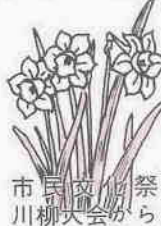
祭ら 柳川市 市民会 柳川市川