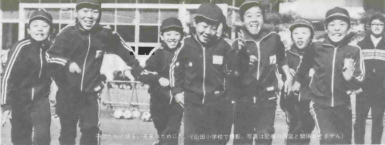
子供たちの明るい未来のために（山田小学校で撮影。写真は記事の内容と関係ありません）

市では、義務教育終了前の児童や生徒を持ち、経済的な理由から就学が困難な家庭のために、「就学援助制度」を設けています。 これは、学用品や修学旅行、医療、学校給食など、お子さんの就学にかかる費用を補助しようというものです。次のいずれかに該当するご家庭は、どうぞ申請してください。 〔対象となる家庭〕 ▽生活保護法による保護が停止または廃止された家庭 ▽児童扶養手当法による児童扶養手当を受けている家庭 ▽保護者の職業が不安定で、収入が少ない家庭 ▽定収入はあるが、家庭内に病氣療養中の方がいて治療費の負担が大きく、学用品費や学校給食費の支出が困難な家庭 ▽標準世帯（父三十五歳、母三十三歳で子供九歳と四歳の四大家族）で、課税対象所得額が二百五十万四千円以下の家庭 〔申込方法〕