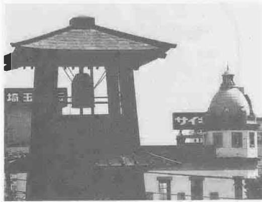
ユニークな風景もとめて

川越といえば、すぐに蔵造りのまち並みや時の鐘が連想されますが、このまちの魅力はそれだけではなくありません。 一歩横丁に足を踏み入れれば、そこは、昔から伝わる「宝物」のような景色であふれています。 番組は、そんな川越のかくれた表情を求めて歩きます。 ※番組に対するご意見・ご要望は秘書広報課広報係(☎内線433・4)へどうぞ。