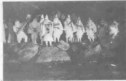
鶴之瀬の「お水送り」