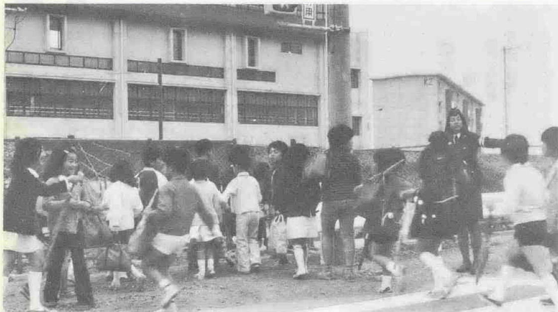
立哨指導などの市民ぐるみの活動成果が実を結ぶ (霞ヶ関東小付近で)

川越市内での交通事故による死亡者は、昨年十二月二十九日以来ゼロの日が続き、四月七日でちょうど百日を記録しました。川越で交通事故による死者ゼロの日が百日を突破したのは、昭和三十六年以来十四年ぶりのことです。 埼玉県内で今年に入ってから死亡ゼロが百日に達したところは、四月七日現在で、川越のほか小鹿野警察署管内だけです。