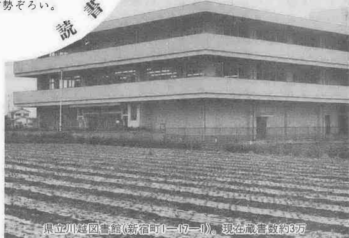
県立川越図書館(新宿町1-17-1)。現在蔵書数約3万