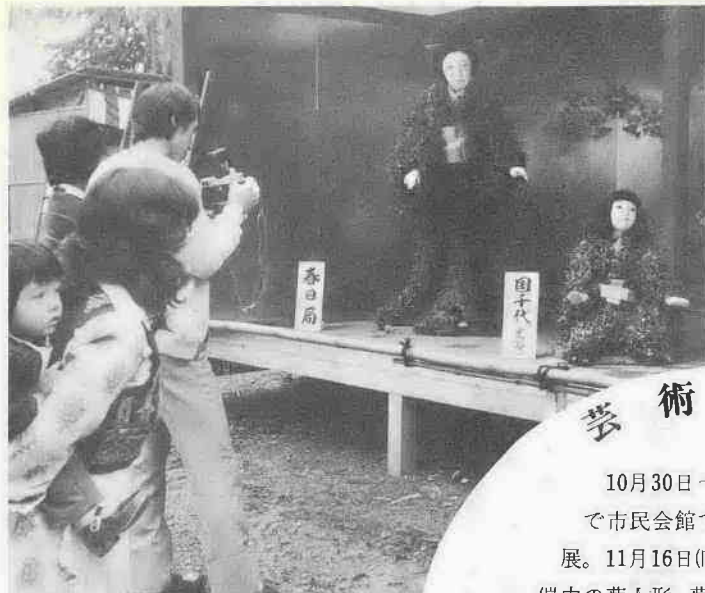
菊人形・菊花展。16日(日)まで喜多院で忠臣蔵をはじめ、20点あまりを展示