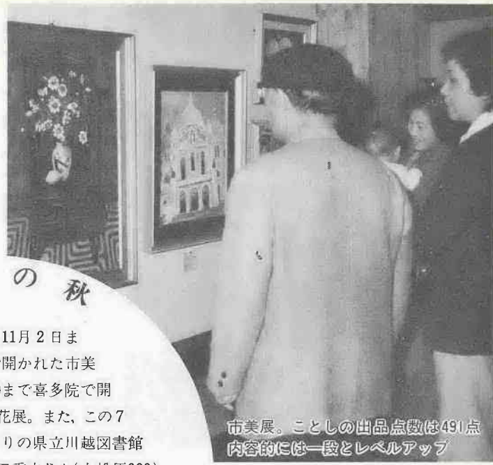
市美展。ことしの出品点数は491点内容的には一段とレベルアップ