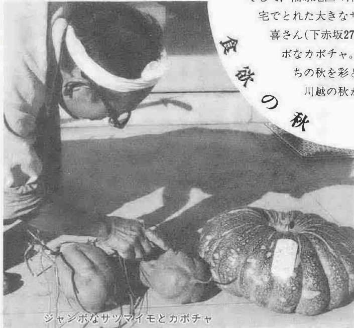
ジャンボなサツマイモとカボチャ