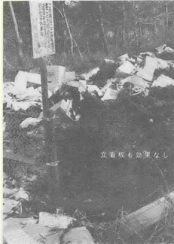
立看板も効果なし

また、地元には監視員もいるのですが、広い山林を常時監視するのは現実問題として不可能で、おまけに夜間や早朝そつと捨てられたのでは、どうにも手の打