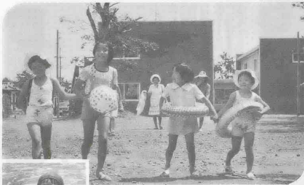
待望の海の家オープン(千葉県山武郡蓮沼村)

今年もあと数日で終ろうとしています。振り返ってみると、インフレと不況の嵐が相変らず衰えを見せないで、私たちの生活を揺さぶり続けたこの一年でした。市政も、不況に伴う税収の伸び悩み、諸経費の増嵩などから深刻な財政危機に見舞われましたが、市民のくらしを守り福祉を増進するために、懸命の努力を続けてきました。川越駅西口区画整理地内の道路開通、海の家新設、新宿町保育園新築、霞ヶ関東小学校開校等々、諸施設が次々に完成をみたほか、市営火葬場の改築工事、仮称名細東小学校・仮称大塚小学校の新築工事に着手するなど、槌音が衰えることはありませんでした。また、市交通災害共済の会費値下げ断行、高年齢者職業相談室の開設、中小企業融資の利子補給実施など、時代に即応したきめ細かい施策を行ったのも、ご存知のとおりです。このように、市民の皆さんのご協力をいただいて、厳しい情勢の中にも、一歩一歩着実な前進を続けてきた市政の一年のあゆみをもう一度追ってみましょう。