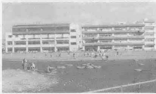
24番目の小学校として開校した霞ヶ関東小