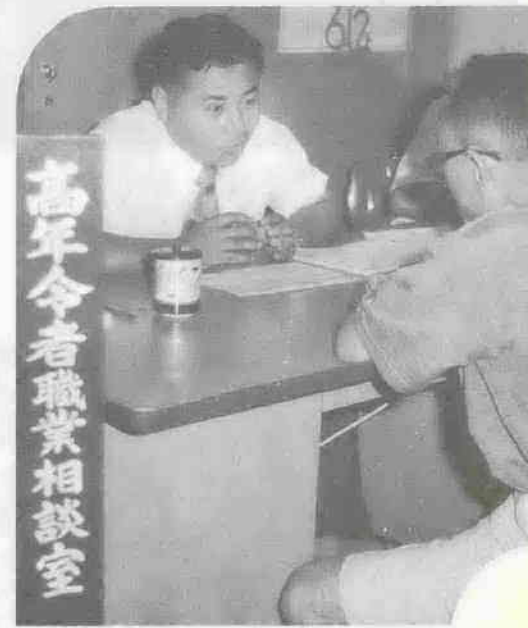
開設以来盛況の続く高年齢者職業相談室

年末年始 ごみ収集のご案内 ごみ収集は、年末年始の市役所の一般業務は十二月二十八日と二十九日、日曜日に当たるため、十二月二十八日から一月四日までの八日間休みとなりますが、ごみ収集と葬祭業務については、それぞれ次の日程で行います。 ごみ収集 ごみ収集は、年末の二十八日は日曜日のため休みですが、二十九日と三十日は平常どおり行いますので、下表をよくご覧の上、お間違いのないようそれぞれの集積所へ持ち出すようにしてください。 地区別 区分 最終収集日 収集開始日 月・木曜日収集地区 12月29日(月) 1月5日(月) 火・金曜日収集地区 12月30日(火) 1月6日(火) 水・土曜日収集地区 12月27日(土) 1月7日(水) 葬祭業務 ◎火葬場 年末は、三十日(友引日)が休業のほか、三十一日まで平常どおり業務を行います。 年始は、一日、二日、三日(友引日)が休業となり、四日からは平常業務となります。 ◎作業場 火葬場と同じですが、三十一日は祭壇の引き取り業務だけで、飾り付けなどの業務は行いませんのでご了承ください。