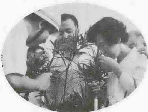
目の不自由な方のために二百五十本の植物を植えた「香りの園」