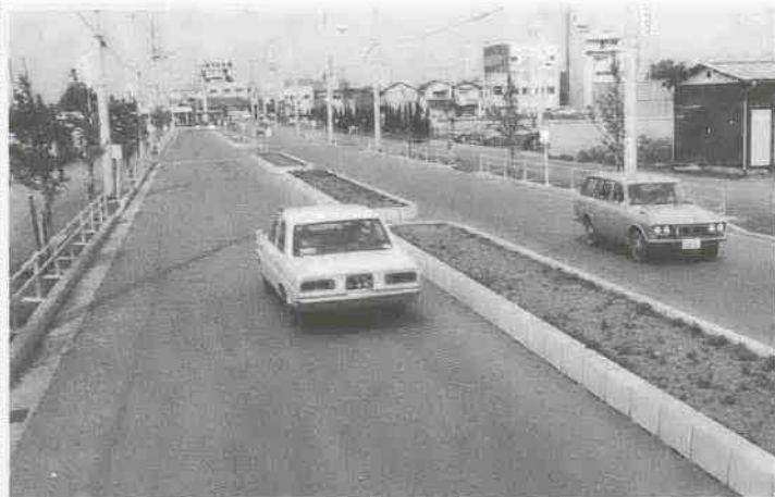
川越駅西口の駅前道路が共用開始に