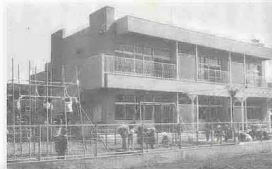
市立では14番目の新宿町保育園