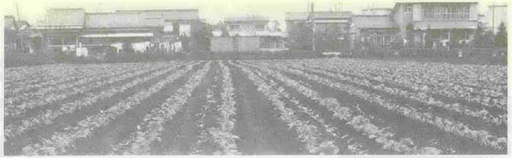
〔市街地の中の指定緑地〕

市では、市街化区域内に、市民生活に必要なうるおいのある環境を保つために、「川越市市街化区域緑地保全に関する要綱」を制定しています。 これは、市が市街化区域内のA農地およびB農地の所有者と緑地保全の協定を結び、その所有者に交付金を出して、緑地を守るために協力してもらおうとするものです。 この制度の主な内容は次のとおりです。