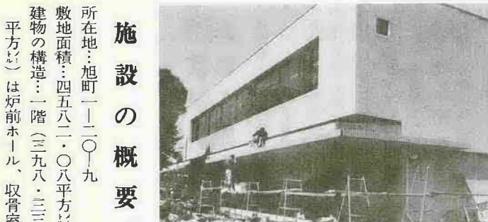
施設の概要 所在地：旭町一〇一・九 敷地面積：四五八二・〇八平方 建物の構造：一階(三九八・三三平方)は炉前ホール、収骨室

死者急増にブレーキ 五十一年一月から四月までの市内の交通事故状況がまとまりました。 これにより、ひん死していた死亡事故にブレーキがかかって、四月中はゼロになりました。しかし、事故件数は相変わらず多く、特に三月まで昨年を下回っていた人身事故件数が、四月までの累計では、昨年をオーバーしてしまいました。